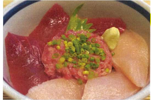
まぐろ屋の三色丼 1,240円