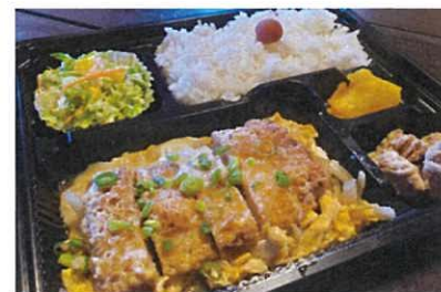
まぐろカツ煮弁当 640円