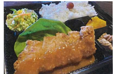
まぐろカツ弁当 640円