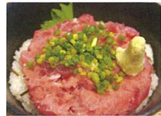
特製ねぎとろ丼 880円