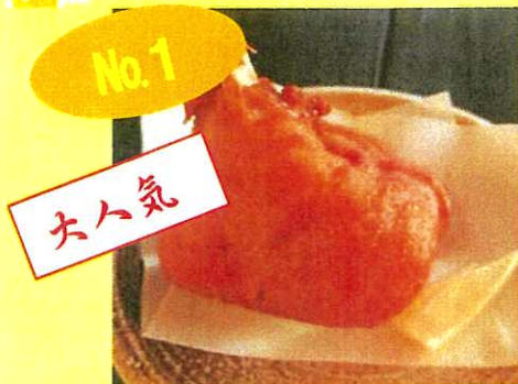
メカジキのあご肉唐揚げ