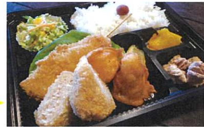
デラックスフライ弁当 750円