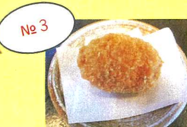
メカメンチコロツケ