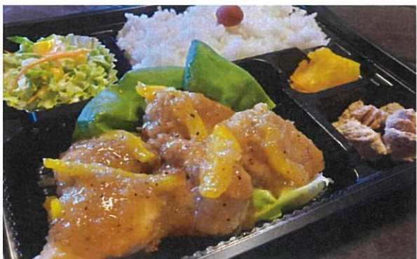
メカジキのあご肉ステーキ弁当