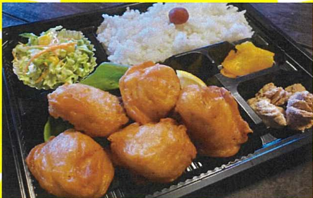
メカジキのあご肉唐揚げ弁当 540円